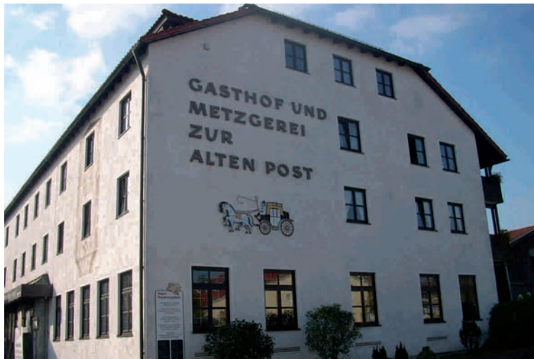
Pension Alte Post

Die Pension, ein Familienbetrieb mit Gasthof und Metzgerei liegt mitten im Dorf direkt am Kurpark. Die Zimmer sind modernst ausgestattet mit Dusche, WC, Fernseher und Telefon. Es gibt einen Frühstücks-, Fernseh- und Aufenthaltsraum, sowie einen schönen Wintergarten. Erholen und entspannen kann man in der Sauna und dem Solarium mit Erlebnis- und Schwallduschen im Haus.