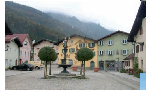
Altstadt Bad Reichenhall